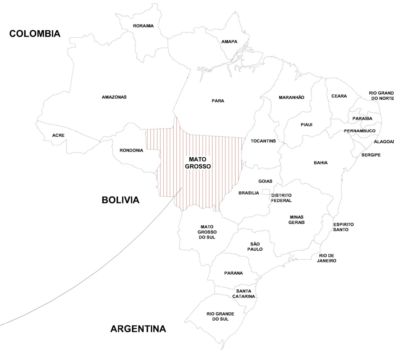
MAPA DO BRASIL