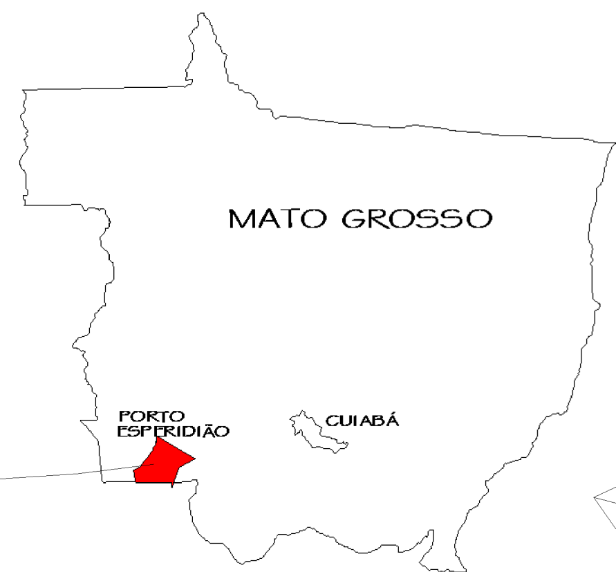
MAPA DE MATO GROSSO