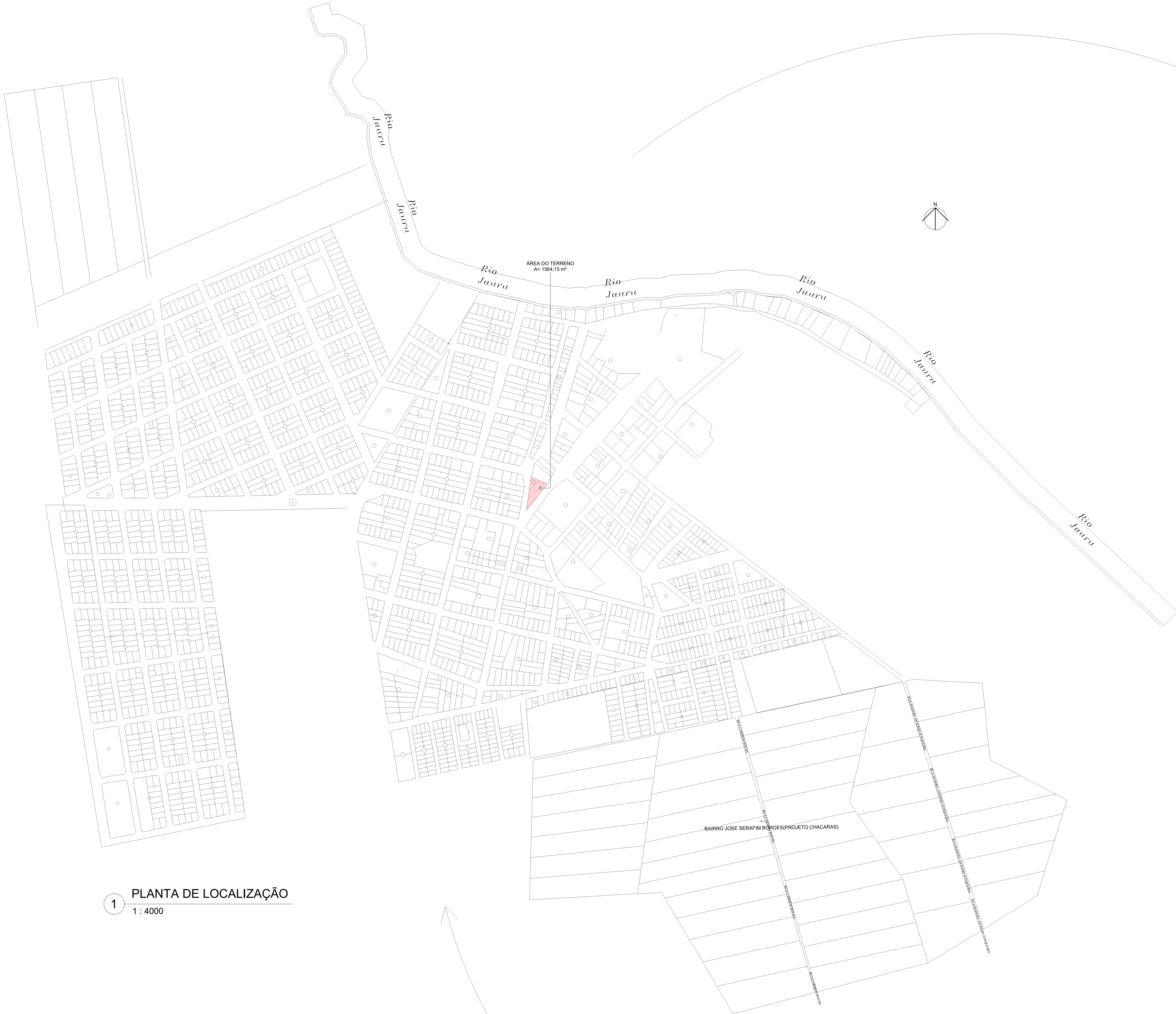
1 PLANTA DE LOCALIZAÇÃO 1 : 4000